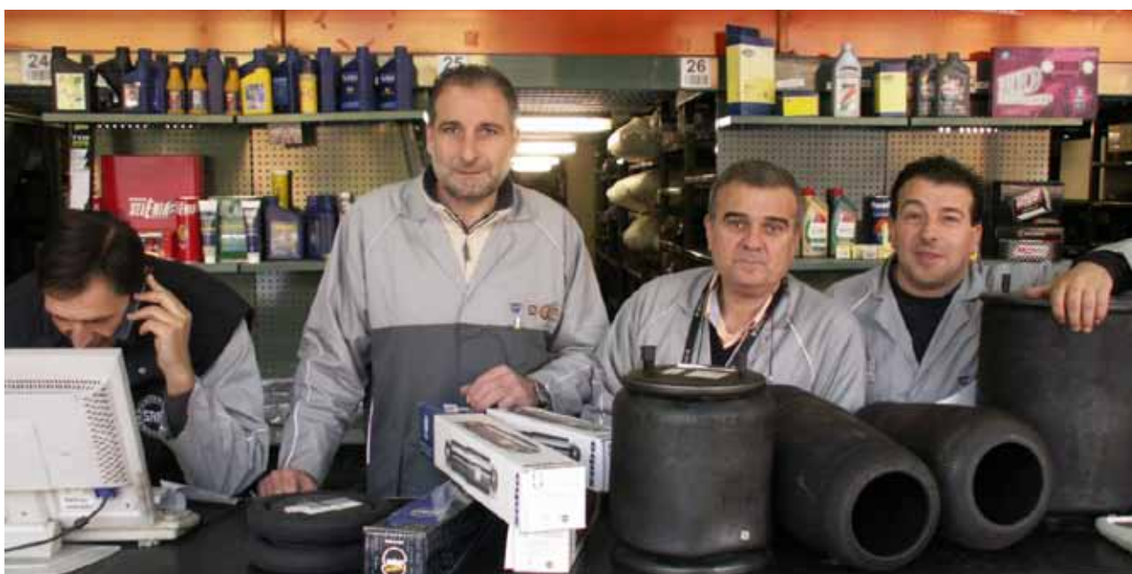
Safi Autotipo: Lo Staff - The staff