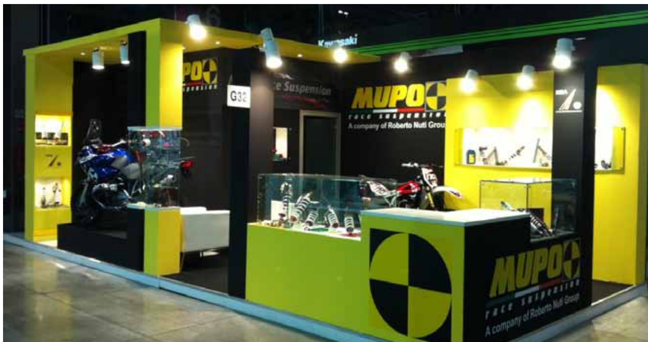
Lo stand Mupo all'Eicma - The Mupo's stand at the Eicma